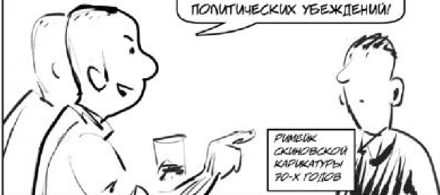
РИСУНОК СКИНОВСКОЙ КАРИКАТУРЫ 70-Х ГОДОВ

ЧУВАК, ЕСЛИ ХОЧЕШЬ СТАТЬ ОДНИМ ИЗ НАС - УСЕКИ - МЫ ДЕРЕМСЯ СО ВСЕМИ, НЕЗАВИСИМО ОТ ПРОИСХОЖДЕНИЯ, РАСЫ И ПОЛИТИЧЕСКИХ УБЕЖДЕНИЙ!